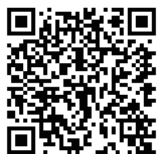
学校採寸専用受注システム